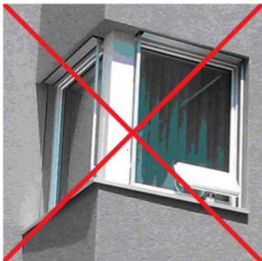
Installation auf Fenstersims von aussen ganz sichtbar