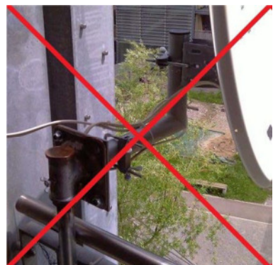
Parabolspiegel mit Schwenkarm